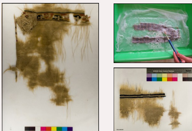
سه قطعه پارچه از مجموعه مردان نمکی