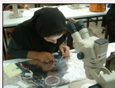
دوره شناسایی الیاف سال ۸۶