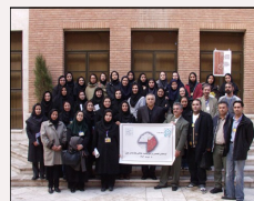
گردهمایی یکروزه بافته ها ۱۳۸۵