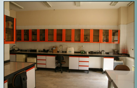
کارگاه فعلی حفاظت و مرمت بافته‌ها

تصویر کل اجی پیک شوره پارچه سوزن درزنی از مجموعه شخصی