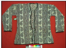
یک نمونه بلاپوش از مجموعه قم