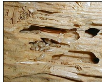
گونه ای از موریانه های چوبخوار