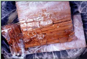
”عوامل آسیب رسان بیولوژیکی (قارچ)”