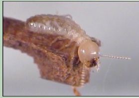
”موریانه بزرگترین آسیب رسان چوب”